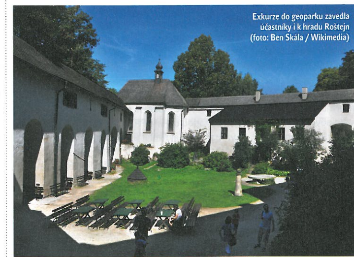
Exkurze do geoparku zavedla účastníky i k hradu Roštejn